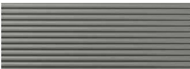
NOVA STRUCTURE New York