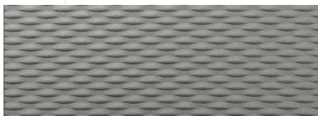
NOVA STRUCTURE Paris